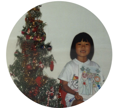
The author, slightly younger than she is now

This year will bring with it my second Swedish Christmas experience. We'll be bringing Maya - our fluffy little kitten along, handing out hand carved mustard spoons made from foraged silver birch wood with small pots of sweet and spicy mustard (a new discovery and favourite!), and hopefully this year I'll remember to pack my stretchy pants.